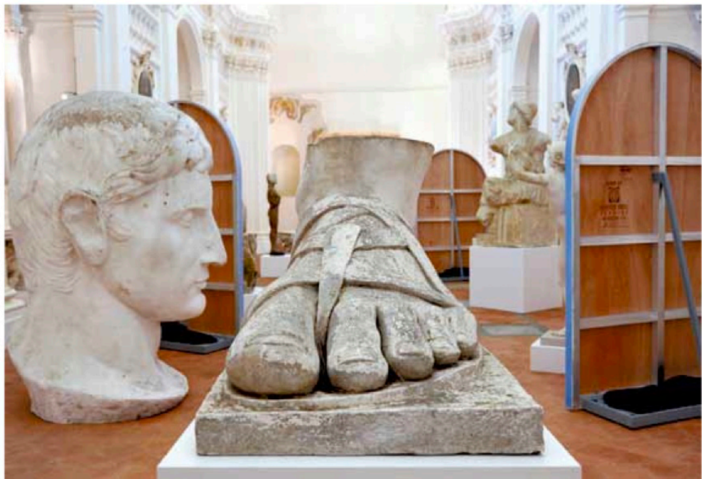
ALEX ISRAEL Vue de l'exposition / View of the exhibition Museo Civico Diocesano di Santa Maria dei Servi, Citta' della Pieve / The Angela and Massimo Lauro Foundation.

"Things I didn't know about Kelly: the crystal meth thing, the step-mother who died during plastic surgery, the supposed connections with the drug cartel." 1