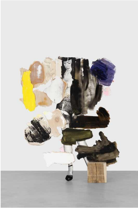
"Bettie", Ida Tursic & Wilfried Mille, 2018.