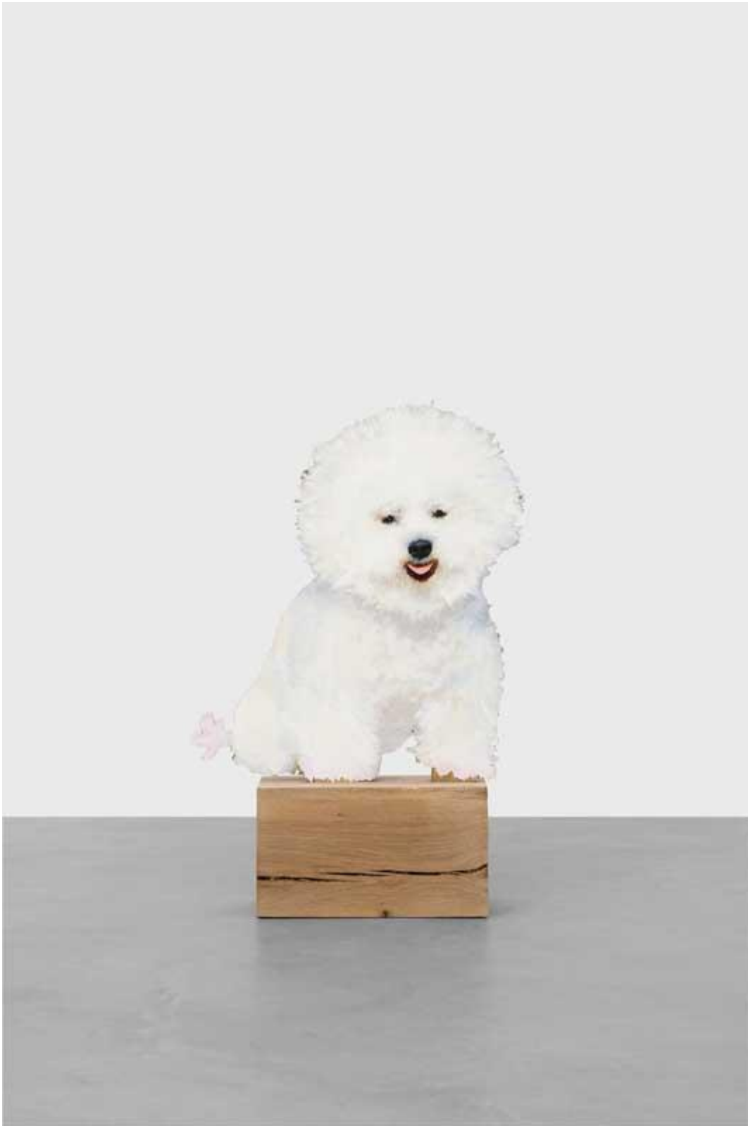
"Happy bichon", Ida Tursic & Wilfried Mille, 2018.