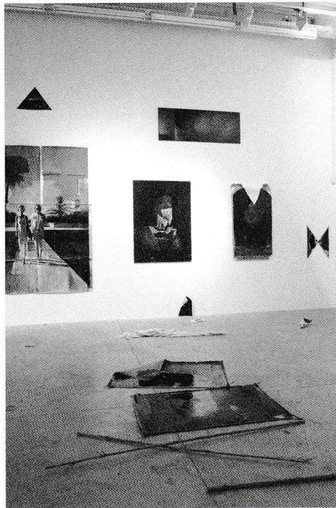
Towerplace , een installatie van Matthieu Ronsse in galerie Almine Rech, Brussel, 2013, Foto Philippe D. Photography.

pornografische naakten. Als geen andere schilder van zijn generatie is hij in staat om de incarnatie of de vleeswording van de verfmaterie op verbluffende wijze te demonstreren. Of het nu gaat om een gekruisigde Christus, een paradijselijke Eva, een provocerende pin-up of een paard in levade, de schilderkunstige middelen staan telkens ten dienste van de sensuele kwaliteiten van de materie, waarbij de huid van het schilderij perfect samenvalt met die van het lichaam.